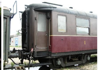
A4D Châssis apparent